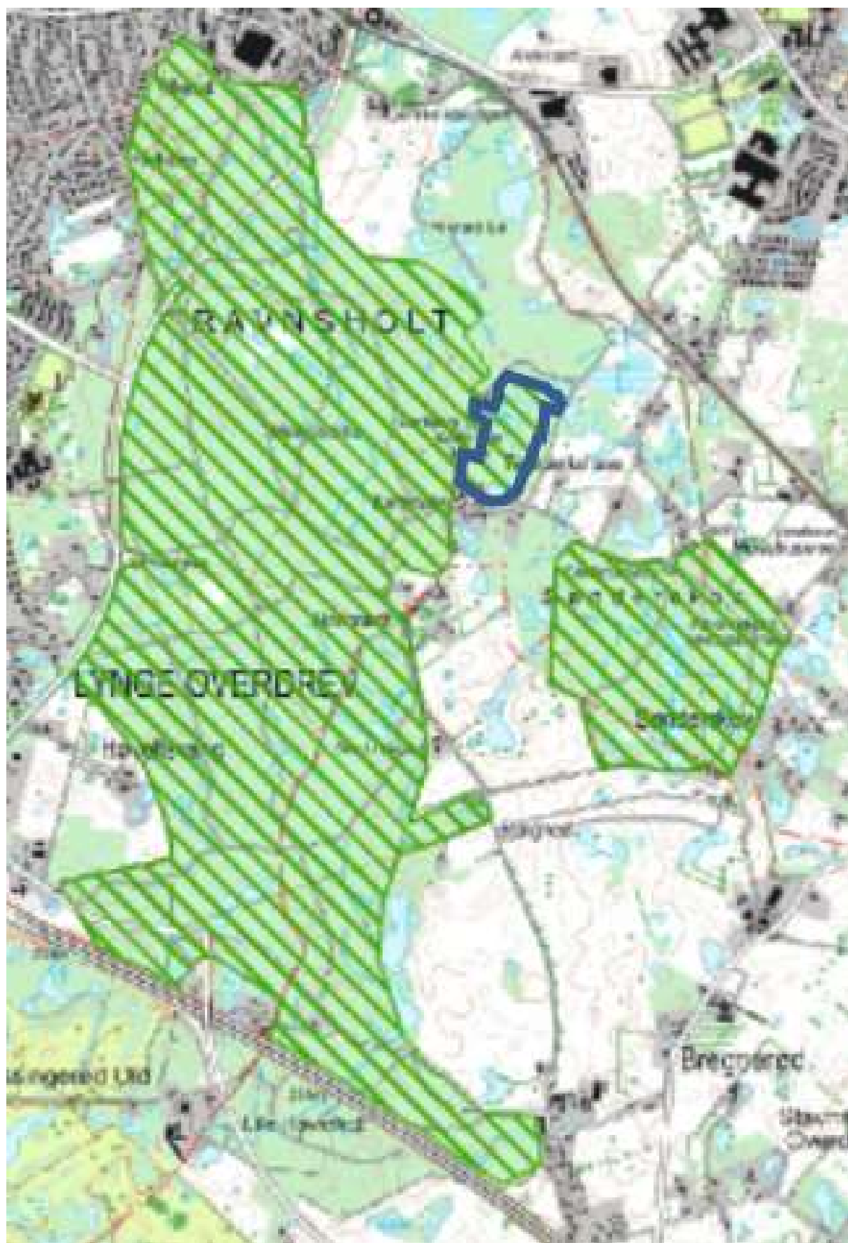
Figur 2. Natura 2000 område 137 med skraveret grønt. Denne rapport omhandler det med blåt markerede areal der omfatter private og kommunalt ejede arealer. Resterende arealer i Natura 2000-område nr. 137 er statsejede fredsskovarealer, hvor Naturstyrelsen udarbejder drifts- og plejeplan.