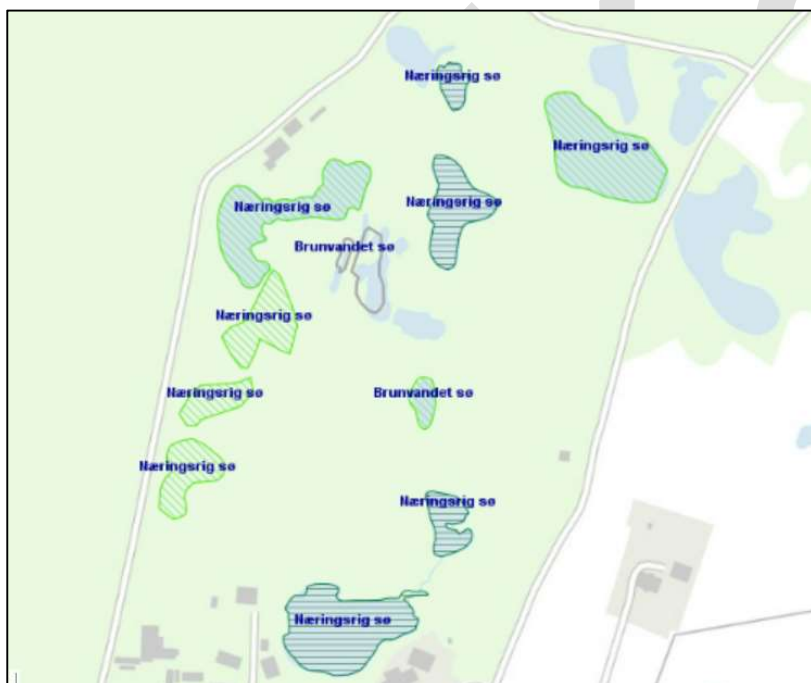
Figur 4. Kortlagte søer under 5 ha. Brunvandet sø mod nord opfattes af Allerød Kommune som flere små søer i tabel 4.

På skovbevoksede arealer vil mange af de tiltag, der implementeres for skovnaturtyperne også være gavnlige for de arter, der er knyttet til naturtyperne. I nedenstående gennemgås eksempler på indsatser, der også gavner arter, hvor indsatserne i forvejen gennemføres i området jf. Natura 2000-planen.