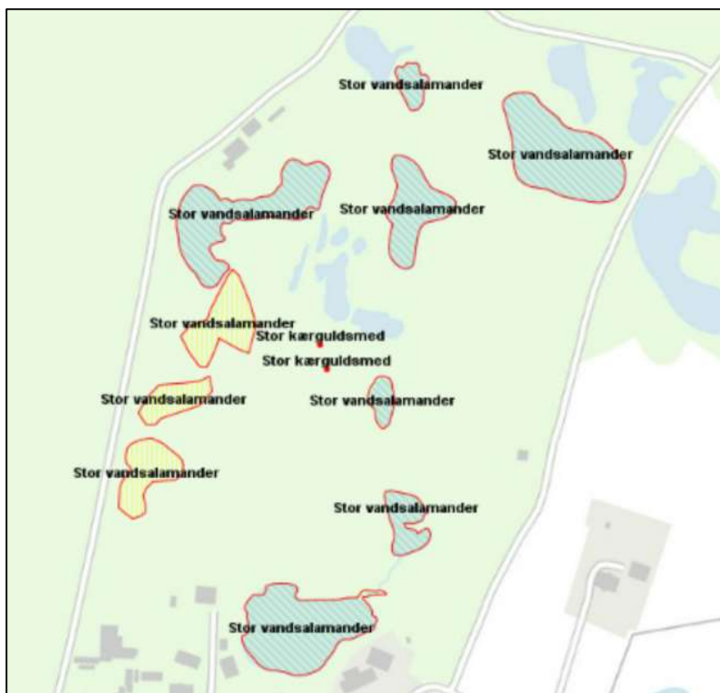
Figur 3. Kortlagte potentielle levesteder for stor vandsalamander samt fund af stor kærguldsmed.