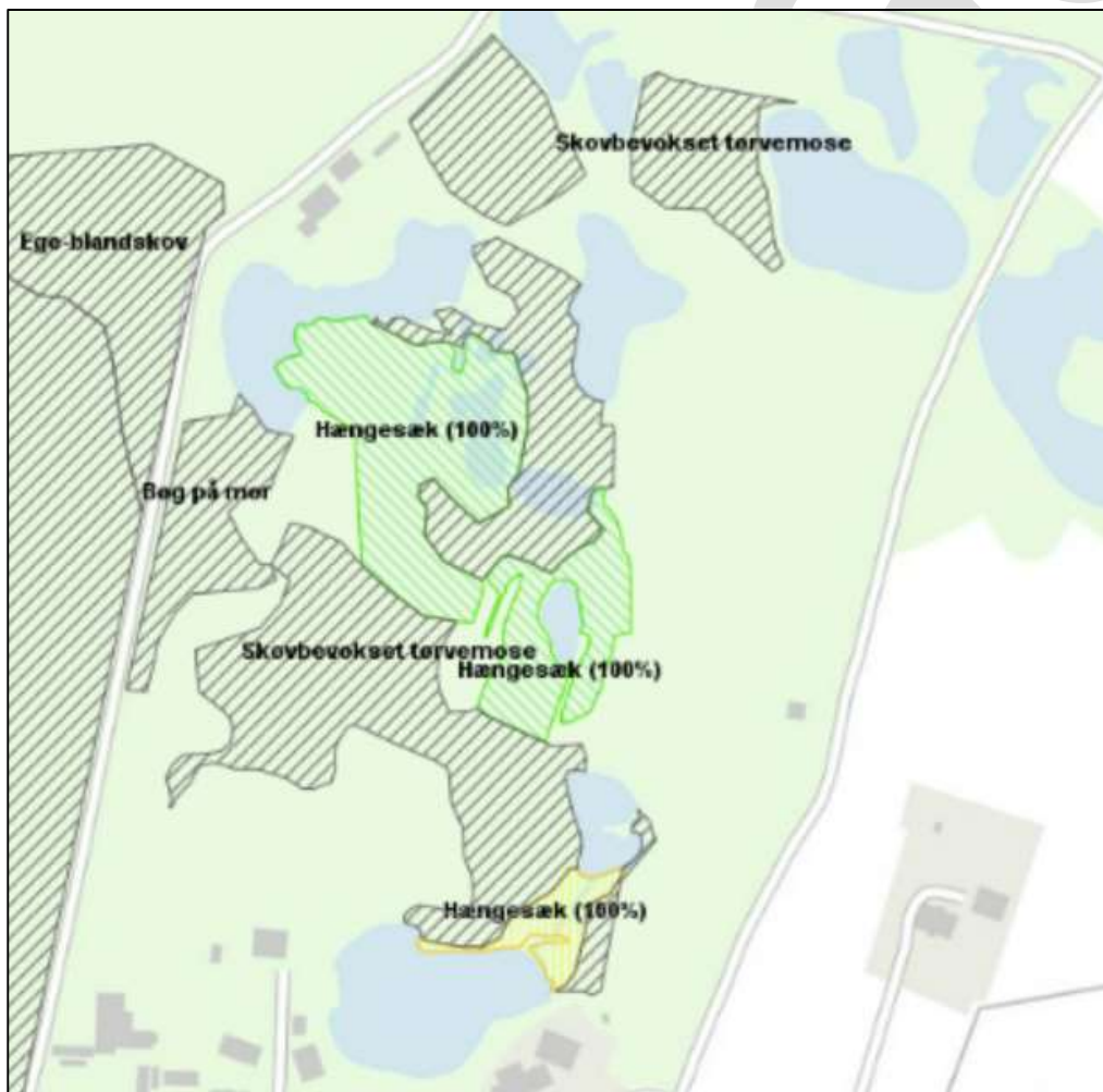
Figur 5. Lysåbne naturarealer og skovnaturtyper

Mindre dele af den udpegede skovbevoksede tørvemose ud mod eksisterende hængesæk plejes i dag som udvidelse/bevarelse af lysåben hængesæk. Dette er en bevidst prioritering i henhold til Naturplanen, da det anses for mere vigtigt at udvikle og bevare hængesæk fladerne end den skovbevoksede tørvemose, der hvor de 2 naturtyper konkurrerer om pladsen.